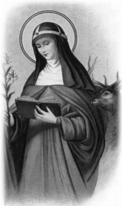
St. Catherine of Sweden.